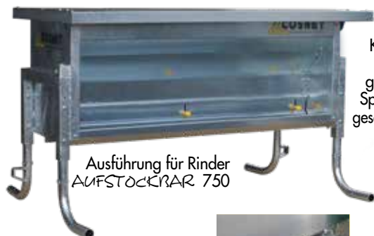
Ausführung für Rinder AUFSTÖCKERAR 750

Kippbares Dach mit gesicherter Sperrung in geschlossener Position.