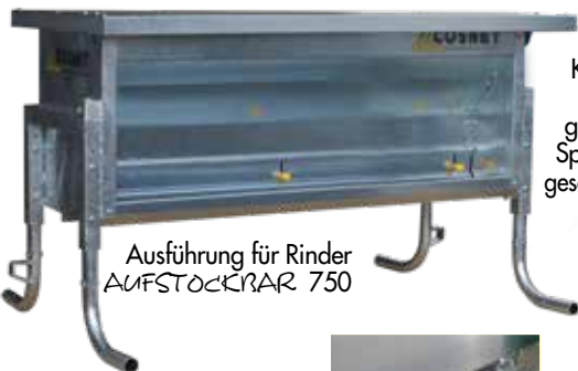
Ausführung für Rinder AUFSTÖCKERAR 750

Kippbares Dach mit gesicherter Sperrung in geschlossener Position.